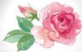
ダマスクス薔薇花油